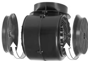
Montaż filtrów węglowych do turbiny

Aby zamontować filtr węglowy należy zdjąć filtr aluminiowy przeciwłuszczowy, następnie przyłożyć filtr węglowy do wlotu powietrza turbiny i przekręcić go zgodnie z ruchem wskazówek zegara aż nastąpi zablokowanie filtra w zaczepach znajdujących się na wlocie powietrza turbiny. Turbina zamontowana w okapie posiada dwa wloty powietrza, tak więc do prawidłowego działania okapu jako pochłaniacza zapachów należy zamontować dwa filtry węglowe po prawej i po lewej stronie turbiny.